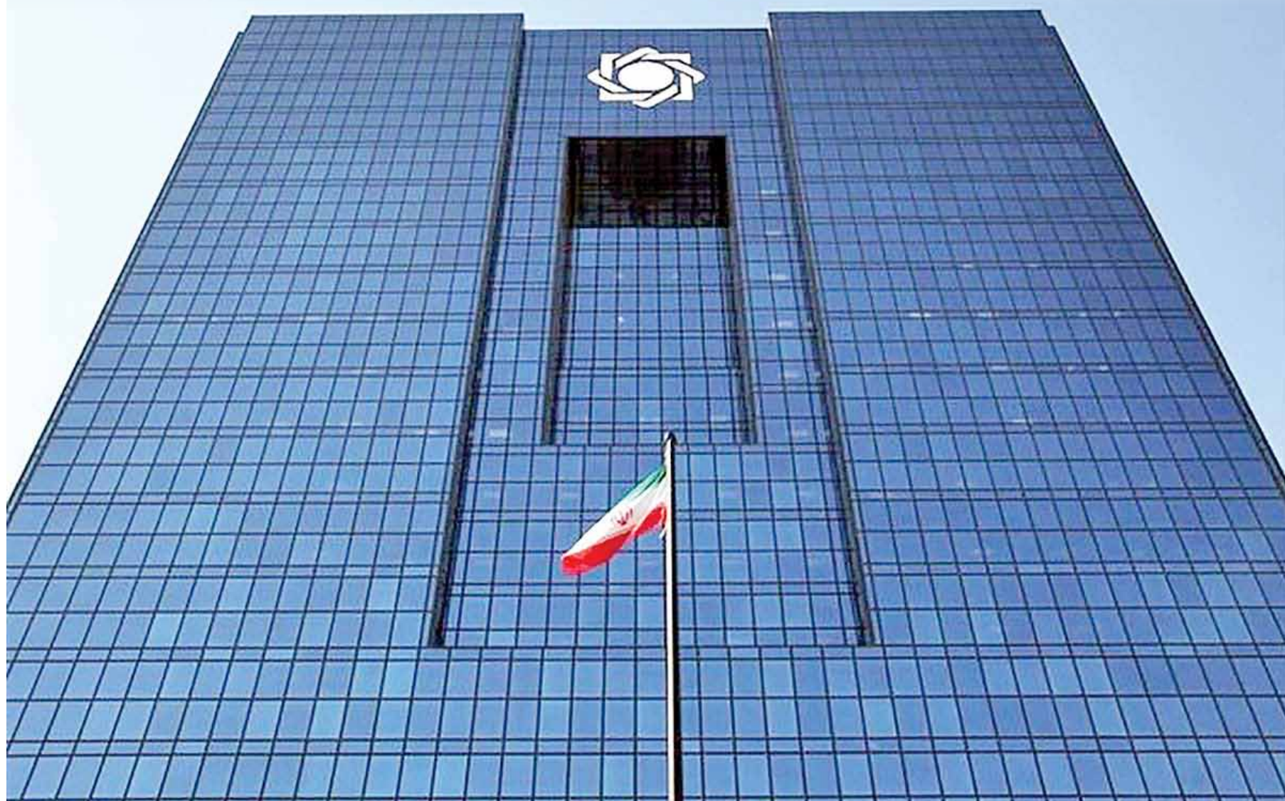
با اجرای پیشنهاد سه گانه سازمان بورس محقق می‌شود

دستورالعمل تسهیلات فرزندآوری به بانک‌ها ابلاغ شد خبر دیگر از بانک مرکزی اینکه این بانک در بخشنامه‌ای به شبکه بانکی دستورالعمل تسهیلات فرزندآوری را برای اجراء به