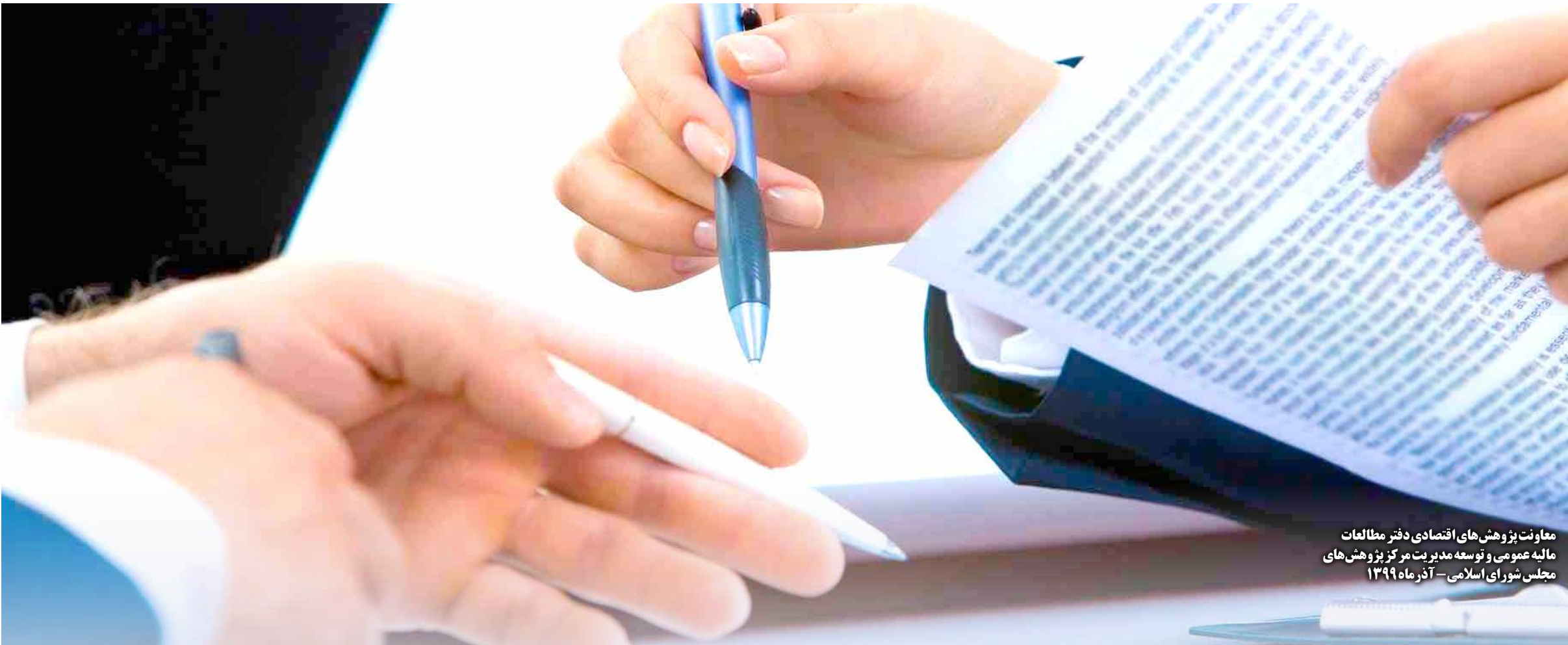
معاونت پز و هوش های اقتصادی دفتر مطالعات مالیه عمومی و توسعه مدیریت مرکز پژوهش های مجلس شورای اسلامی - آذر ماه ۱۳۹۹