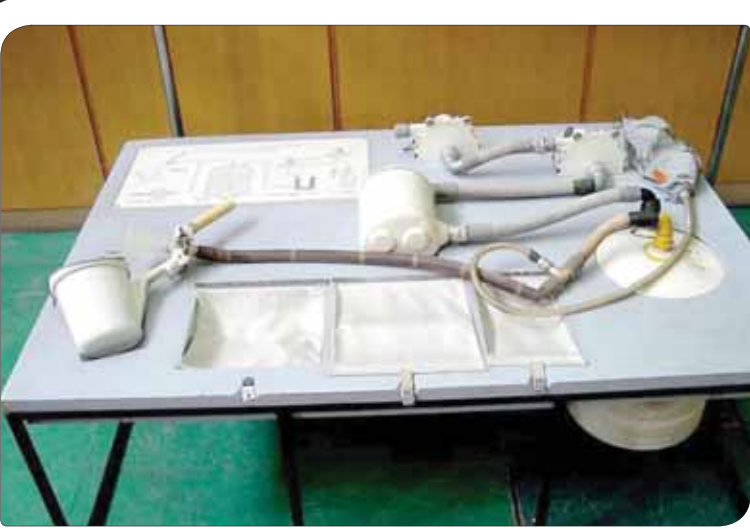
کریس هادفیلد، فرمانده سابق ایستگاه بین المللی فضایی به تازگی تصویری از سرویس بهداشتی سفینه فضایی سایوز را منتشر کرده است. تصویر ارائه شده جزئیاتی از سرویس بهداشتی سایوز را به نمایش می گذارد.

چاپ مقالات و نظرات در این نشر به به معنای تأیید یا رد آن مطالب نبوده و «مناقشه مزبیه» دارای منشی مستقل خود می باشد.