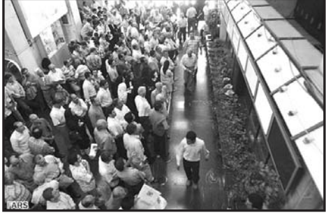
تجمع مردم در بازار تهران