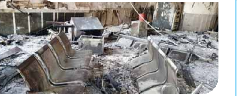
تولید گاز در تاسیسات صنعتی

آلودگی هوای کلاشهرها مسأله عجیبی نیست، مخصوصاً برای ساکنین تهران آلودگی هوا چیز غربی نیست اما در تاریخ این کلاشهر هم هیچ وقت تعطیلی ۱۲ روزه مدارس طی یک ماهه نداشتیم رخ نداده بود! از هشتمین روز آذر تا واسطه دی ماه دانش آموزان تهرانی روزهای شادای را سپری کردند و هر شب در انتظار خبر به مدرسه رفتن و یا رفتن خود بودند و خبر تعطیلی تمامی مدارس تهران به غیر از پردیس و فیروزکوه تا مدت ها نقل شبکه های اجتماعی بود! اوضاع برای دیگر کلاشهرهای کشور نیز بهتر از تهران نبود و به تنایب مدارس در ارومیه، کرج، اصفهان، سساوه، یوکان، سمنان، خوزستان، مشهد، اراک، کردستان، کرمانشاه، خرمشهر، آبادان، قزوین، تبریز و... نیز طی این مدت درگیر آلودگی هوا بودند تا بدین ترتیب خاکستری ترین ماه های تاریخ کشور را شاهد باشیم. روزهای کاملاً آلودی!