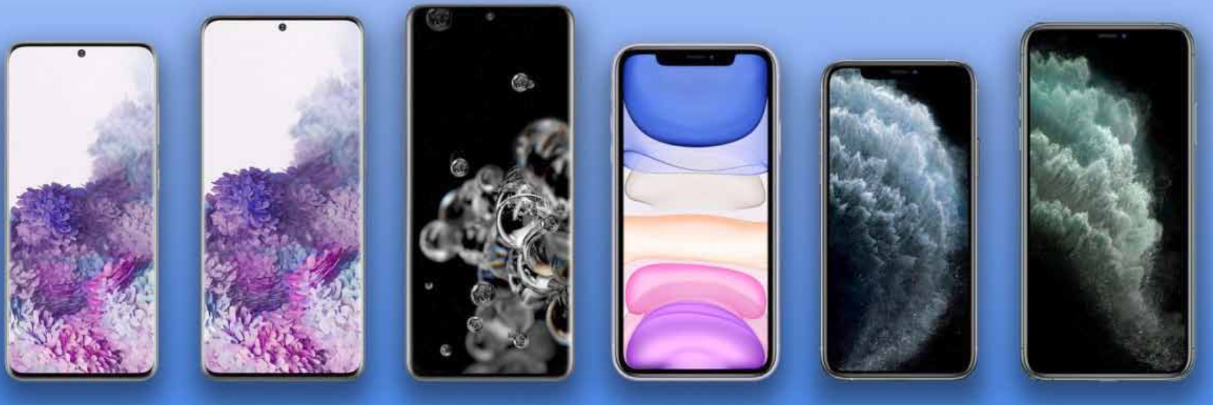
عضو هیأت رئیسه مجلس شورای اسلامی درباره بازار موبایل مدعی شد

صمت و وزارت ارتباطات و فناوری اطلاعات نرسیده است، بنابراین تا زمان ابلاغ رسمی به گمرکات، قابلیت اجرایی نخواهد داشت. به گفته عباسپور، همچنین براساس صورت‌جلسه مربوطه، واردات به صورت مسافری با رعایت فرآیندهای مرتبط با رجیستری کالا در مورد گوشی‌های تلفن همراه بالای ۳۰۰ یورو نیز ممنوع نبوده، اما در نهایت، تصمیم‌گیری نهایی با تأیید کمیته مشترک میان بانک مرکزی، وزارت صمت و وزارت ارتباطات و فناوری اطلاعات صورت خواهد گرفت که متعاقباً اطلاع‌رسانی خواهد شد. این تصمیم در حالی گرفته شده که به نظر می‌رسد بهترین راه‌حل دولت برای مشکل واردات و کمبود گوشی باشد. در این راستا محمدجواد آذری جهرمی؛ وزیر اول و رئیس هیأت مدیره انجمن همراه بالای ۳۰۰ یورو دارای سه ایراد جدی است، با تأکید بر ضرورت رعایت اولویت‌های منابع ارزی کشور، بنا شد این تصمیم بازنگری شود. پیش از این ممنوعیت واردات گوشی‌های بیشتر از ۳۰۰ یورو رئیس کل بانک مرکزی و همچنین سرپرست وزارت اقتصاد و امور دارایی، تبت و لوازم جانبی مطرح شده گرفته بود. به دلیل محدودیت‌های مالی و ارزی مشکلات موجود، دولت پولی ندارد که بخواهد مثل قبل به همه واردکنندگان تخصیص دهد. به همین خاطر واردات با محدودیت بسیار بزرگی مواجه