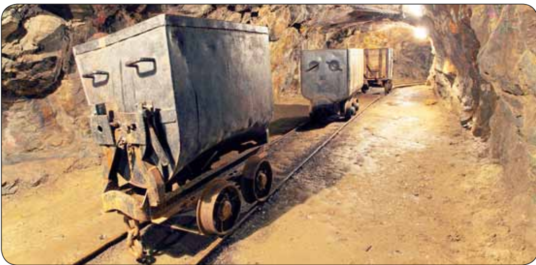
به این دلیل که تقاضا برای ماده کاهش پیدا کرده باشد و با این حال ممکن است استخراج از معدنی سوددهی مورد انتظار را نداشته باشد؛

ایمن کارشناس، خاطر نشان کرد: فعالسازی معادن غیرفعال امری ساده نیست؛ نیاز به ورود نهاد‌های دولتی دارد و بخش خصوصی بر خلاف صنایع دیگر به تنهایی نمی‌تواند از عهده آن برآید. به عبارت دیگر بخش خصوصی در صورتی می‌تواند بر استخراج معدن سرمایه‌گذاری کند که زیرساخت‌های مورد نیاز برای معدنکاری توسط بخش دولتی و از محل دریافت حقوق دولتی فراهم شود. در واقع بخش دولتی باید زمینه مناسب برای اقتصادی بودن استخراج را فراهم کند تا معدن تبدیل به بستر مناسب برای سرمایه‌گذاری بخش خصوصی شود. معاون معادن و صنایع معدنی شرکت توسعه معادن و فلزات، در تشریح چالش‌های مربوط به معادن متروک، تصریح کرد: افزون بر نبود زیرساخت‌ها استخراج معادن می‌تواند به دلیل مشکلات حقوقی متوقف و معدن متروک به‌طور مثال مالک کنونی معدن آن را رها کرده اما اگر معدن از او گرفته و به شخص دیگری واگذار شود، امکان بهره‌برداری به وجود می‌آید. در این مورد نیز نیاز به مداخله بخش دولتی برای هموارسازی مسیر استخراج از معدن وجود دارد.