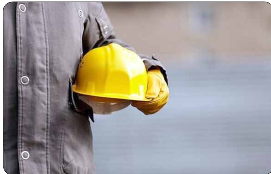
که نمایندگان مجلس از تورم ۶۰ درصدی سخن به میان آورده‌اند و همچنان دلار وضعیت نامشخصی دارد تا این قشر بیشتر از دیگر اقشار جامعه در در احساس کند.