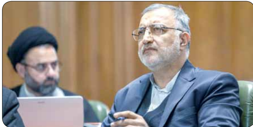
همچنین خبر داد: تونل دو طبقه ۹ کیلومتری شهید متوسلیان از ماه آینده وارد مناقصه می‌شود. وی در پاسخ به پرسش خبرنگاران در خصوص ساخت معابر، گفت: ما تهران را به سمتی می‌بریم که شهر انسان محور از طریق مناسب‌سازی باشد و از مسیر هوشمندسازی تسهیلات را در اختیار مردم قرار دهیم که در این راستا سه اندازه‌ساخته می‌شود. زاکانی؛ عنوان کرد: در استانه یک حرکت و کار کردهای بزرگی هستیم

استان البرز شاهد بیشترین مهاجرت از شهر تهران بود که عدد اسفناکی است.