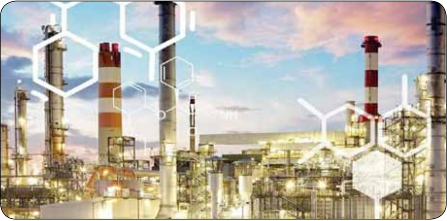
و این مجتمع تا نیمه دوم تیرماه به بهره‌برداری می‌رسد و از مراد، محصول تولید و شرکت در آم‌دزایی و سود سهامداران پترول نیز محقق می‌شود. مدیرعامل شرکت پترول، با بیان اینکه گچساران با بهره‌گیری از توان داخلی به ایرانی‌ترین الفین کشور تبدیل شده و حداقل ۷۶ مورد از تجهیزات اصلی آن توسط جوانان همین کشور ساخته شده است، گفت:

تعمیرات داخلی پتروپالایشگاه‌ها، به همراه تکمیل مجتمع پتروشیمی گچساران، با اشاره به ظرفیت بالای تولیدکنندگان و شرکت‌های دانش بنیان صنعت پتروشیمی، گفت: با برداشته شدن تحریم‌ها، تولیدکنندگان داخلی می‌توانند در مناقصات و پروژه‌های بین‌المللی شرکت کرده و توان خود را به رخ دنیا بکشند.