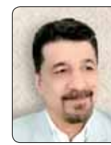
علیر ضارناری مشاور و مدرس حل مسأله و توسعه بازار