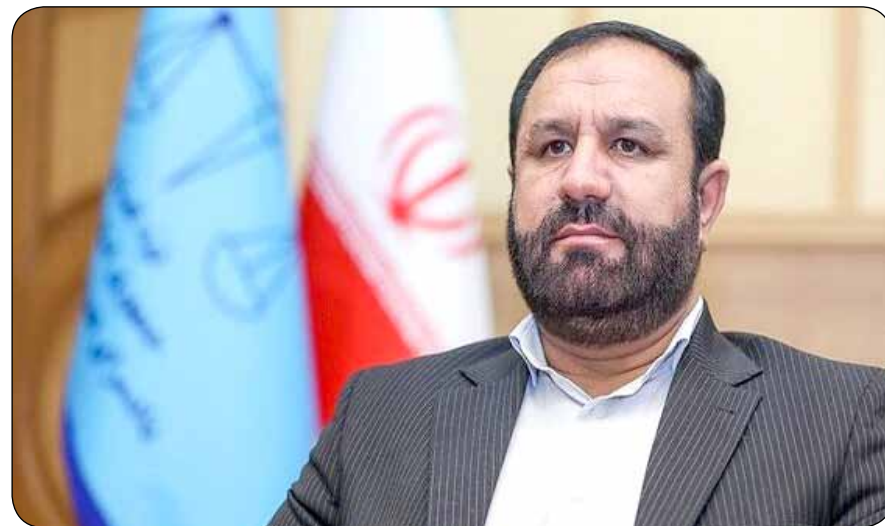
برسید. وی با بیان اینکه رفتار و عملکرد دادستان‌ها به ویژه در حوزه برخورد با رباب‌ر جوع، برای همکاران قضایی و اداری الگو محسوب می‌شود، اضافه کرد: تلاش جدی دادستان‌ها بر انگیزه

دادستان تهران، بر لزوم تشکیل شورای پیشگیری از جرایم و تخلفات انتخاباتی، تأکید کرد. به گزارش مناقصه مزایده، دومین همایش قضایی دادستان‌های استان تهران، در سالن جلسات دادستانی تهران برگزار شد. علی صالحی، دادستان تهران، در این جلسه، با اشاره به تأکیدات رئیس قوه قضاییه مبنی بر لزوم تسریع در رسیدگی به پرونده‌های قضایی و تکریم ارباب رجوع، اظهار کرد: ایجاد تحول و سرعت در رسیدگی به پرونده‌ها و مشکلات شهروندان، نیازمند همت و تلاش جهادی است که برای تحقق آن لازم است همکاران در خارج از اوقات اداری نیز در راستای حل مشکلات مردم کوشش کنند. وی در ادامه، ضمن قدردانی از عملکرد دادسراهای شهرستان‌های استان تهران در حوزه‌های مختلف، بر لزوم افزایش بازبدهی‌های میدانی دادستان‌ها از شعب تأکید کرد و افزود: بازرسی‌های میدانی بسیار تأثیرگذار بوده و لازم است با افزایش میزان بازبدهی‌ها و احوالی مشکلات، برنامه‌ریزی مناسب نسبت به رفع چالش‌ها صورت گیرد. دادستان تهران، کاهش آمار پرونده‌های قدیمی و مسن را مستلزم صرف وقت و تلاش جهادی جهت رسیدگی به مسائل مردم عنوان کرد و افزود: در این راستا باید با اولویت‌بندی و برنامه‌ریزی به منظور رسیدگی به