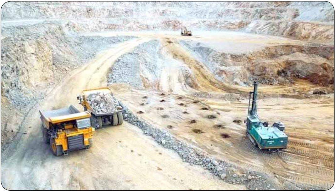
تنها به سمت تولید، بلکه در مسیر استفاده از فولاد سبز گام برمی‌دارد. وی تصریح کرد: طبق آمارها حدود حداقل ۲۰ گیگاتن باطله معدنی ۱۴ و بیلیون تن باطله فرآوری در جهان تولید می‌شود و انتشار ذرات گازه‌های گلخانه‌ای باعث افزایش گرمایش زمین می‌شود. عضو هیئت مدیره ایمپاسکو، ادامه داد: صنعت فولاد یکی از تولیدکنندگان قابل توجه دی‌اکسید کربن در جهان بوده و بین هفت تا هشت درصد از کل دی‌اکسید کربن منتشر شده را تولید می‌کند.

دی‌اکسید کربن منتشر شده را تولید می‌کند. وی توضیح داد: تقاضای نامرشد معدنی سبز و تولید فولاد سبز میان امیدواری و نگرانی‌ها بزرگ معدنی کشور (شرکت‌های چادرمول، تهیه ویراسکو)، فراخوان «فولاد سبز و معدنی سبز» را انجام و تأمین اعتبار می‌کند. دست‌چردی؛ افزود: پایداری تولید فولاد سبز براساس نتایج پروژه مطالعاتی مذکور انجام و در صورت لزوم شرکت‌های فولادی در این برنامه همکاری‌های لازم را با ایمپدرو انجام خواهند داد. وی بیان کرد: کشور ما نیز باید همراه با سایر کشورهای تولیدکننده فولاد فعالیت خود را در راستای تولید فولاد سبز افزایش دهد. اجرای برنامه‌های تحقیقاتی، توسعه‌های عملیاتی در این زمینه با اختصاص ردیف بودجه‌ای همراه با اعمال یک رشته سیاست و قوانین برای جایگزینی فرآیند تولید فولاد کم‌کربن ضروری است. عضو هیئت مدیره ایمپاسکو، در پایان خاطر نشان کرد: فولاد سبز آشنا شده و آن را فرابگیرند.