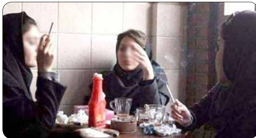
حدادی‌پیدا می‌کند، توضیح داد: رشد ۱۳ درصدی استعمال دخانیات در حوزه نوجوانان ۱۳ تا ۱۵ ساله شرایط خاصی ایجاد کرده است؛ این امر در دختران نوجوان حادث‌تر است و شاهد رشد کرد: ۸۰ تا ۷۰ درصد کسانی که اعتیاد سنگین دارند اعتیاد