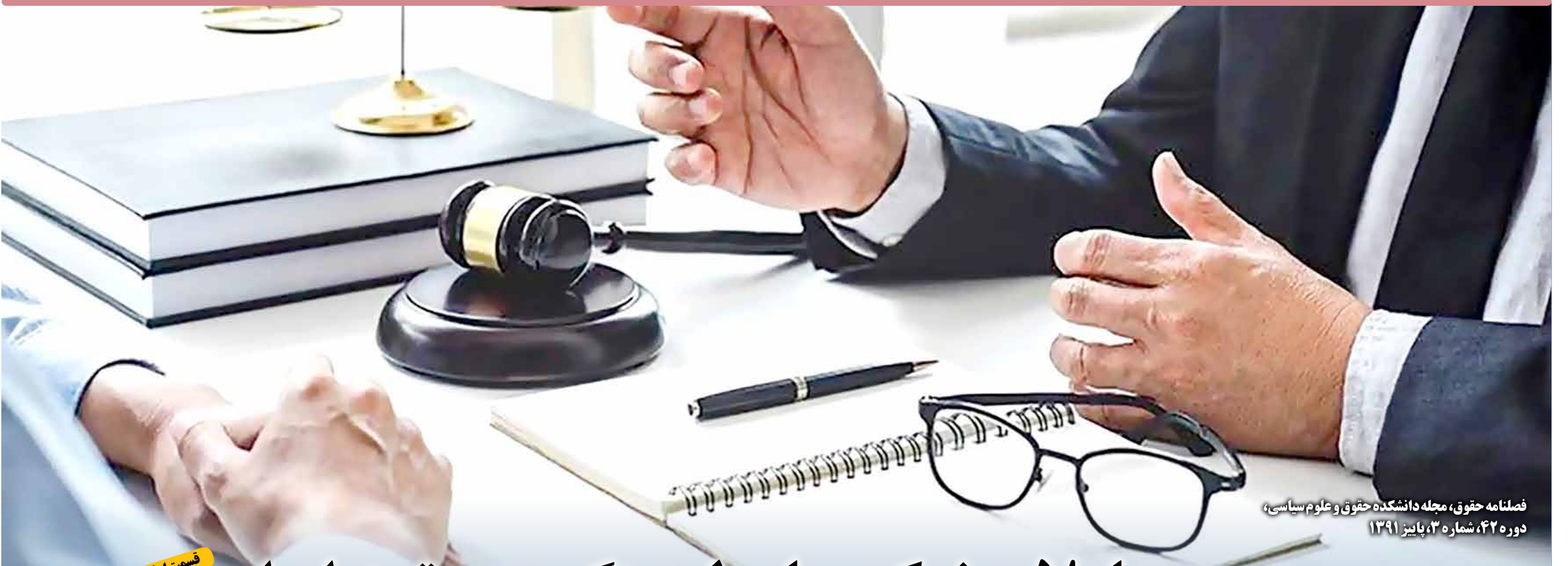
فصلنامه حقوق، مجله دانشکده حقوق و علوم سیاسی، دوره ۴۲، شماره ۳، پاییز ۱۳۹۱

طبق اصل ۱۲۸ قانون اساسی، مصوبات دولت نباید خلاف قوانین باشد، در صورتی که رئیس مجلس مصوبه‌ای را خلاف قوانین بداند، در واقع آن مصوبه بی‌اعتبار است و تا هنگامی که اصلاح نشود، نمی‌توان برای آن اثری قائل بود و براساس قانون نحوه اجرای اصول ۸۵ و ۱۳۸ قانون اساسی و نظریه تفسیری جلسه مورخ ۱۳۹۱/۱۳/۱۰ شورای نگهبان؛ هیئت وزیران پس از اعلام نظر رئیس مجلس شورای اسلامی، مکلف به تجدیدنظر و اصلاح مصوبه خویش است؛ در غیر این صورت پس از گذشت مهلت مقرر قانونی، مصوبه مورد ایراد ملغی‌الآثر خواهد شد. بند ۵ اصلاحیه آیین‌نامه ارزیابی کیفی مصوب ۱۴۰۰ که دایره شمول ارزیابی ساده مصوب ۱۳۸۵ را توسعه داده بود، توسط رئیس مجلس طی نامه شماره ۸۴۴۶۱/هـ مورخ ۱۳۹۰/۲/۲۹، ۱۴۰۰، مورد ایراد واقع شد و چون دولت در یک هفته مهلت قانونی برای اصلاح این ایراد ترتیب اثری نداده این بند از مصوبه لغو شد. با توجه به شرح ایراد که اذعان داشته؛ «نظر به اینکه مستثنیات از شمول قانون با ارفاق قوه قانون‌گذار در متن قوانین مربوط مورد تصریح قرار می‌گیرد، علی‌هذا اجرای سه‌گانه مندرج در ذیل بند ۵ مصوبه اصلاحی ناظر به اصلاح ماده ۱۱ مصوبه اصلی که ارزیابی کیفی مورد نظر قانون‌گذار به شرح مندرج در ماده ۱۲ قانون برگزاری مناقصات مصوب ۱۳۸۳ را با قائل شدن استثناء از شمول حکم قانون منوط به تشخیص دستگاه مناقصه‌گزار می‌نماید، از