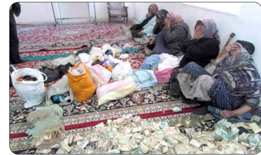
به چه کسی واقعاً باید کمک کرد؟

وقتی پای کمک به نیازمندان و همراهی با فعالیتهای خیریه ای در میان باشد، نخستین سؤالی که به ذهن افراد خطور می کند، آن است که چگونه نیازمندان واقعی را بشناسیم؟ چطور مطمئن شویم که کسی واقعاً نیازمند است و کمک های