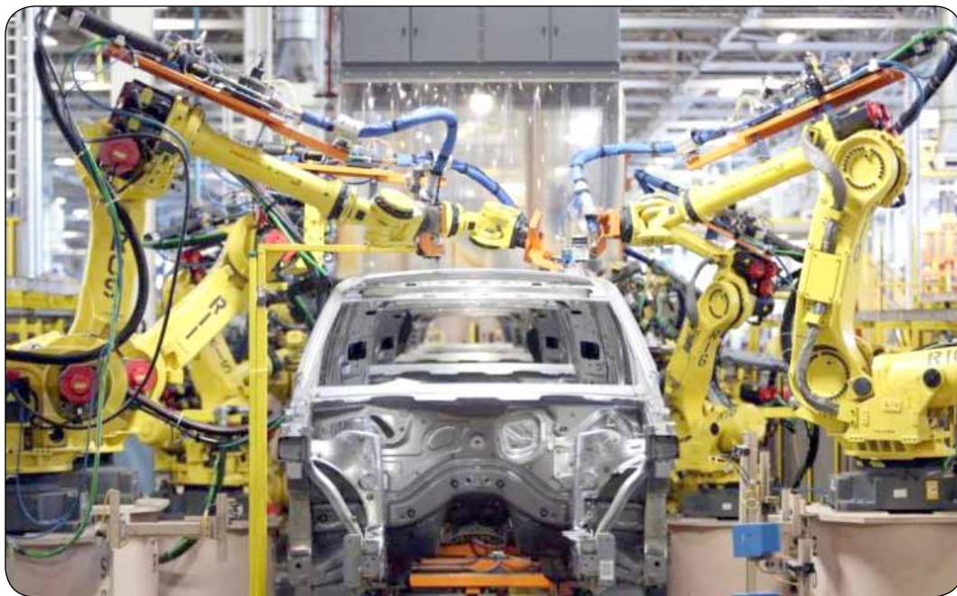
داخل برای خودروهای مونتاژی در حوضه بن‌ساز، عمل‌کاری انجام نشده، زیرا خودروها وارداتی هستند و بن‌ساز به دلیل استفاده از ماشین‌آلات مونتاژی، نیازمند سرمایه‌گذاری در بخش مونتاژ است.