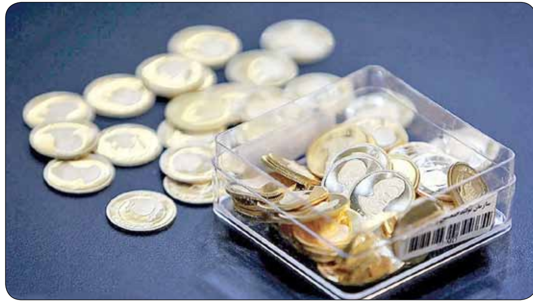
گروه بازار سرمایه | مناقصه