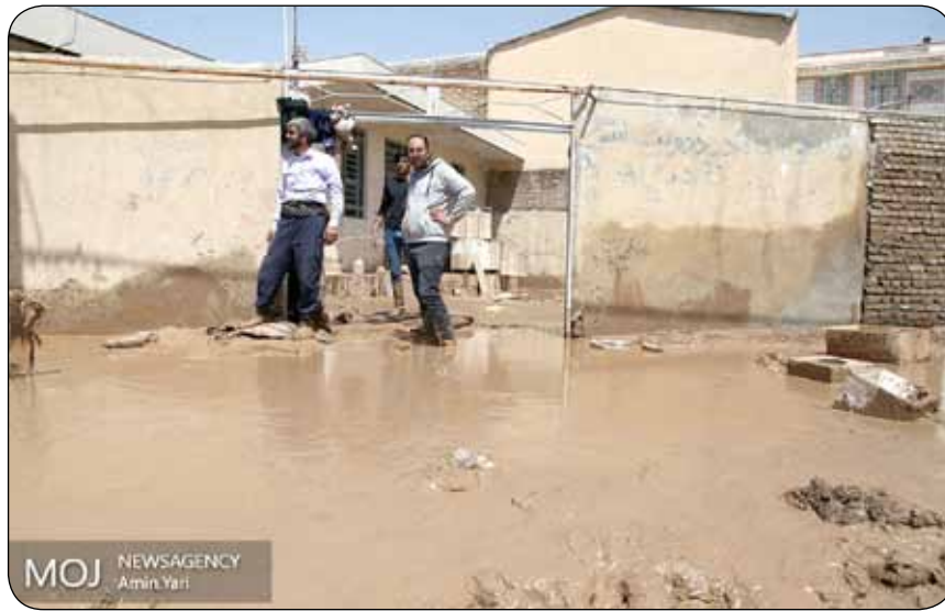
آخرین وضعیت مناطق سیل‌زده سیستان و بلوچستان از بین رفتن راه دسترسی، آبگرفتگی منازل مردم، عدم امدادسانی به‌موقع، کمبود آب آشامیدنی و غذا، از بین رفتن امدادسانی ناشی از سیل در دومین استان پهناور کشور