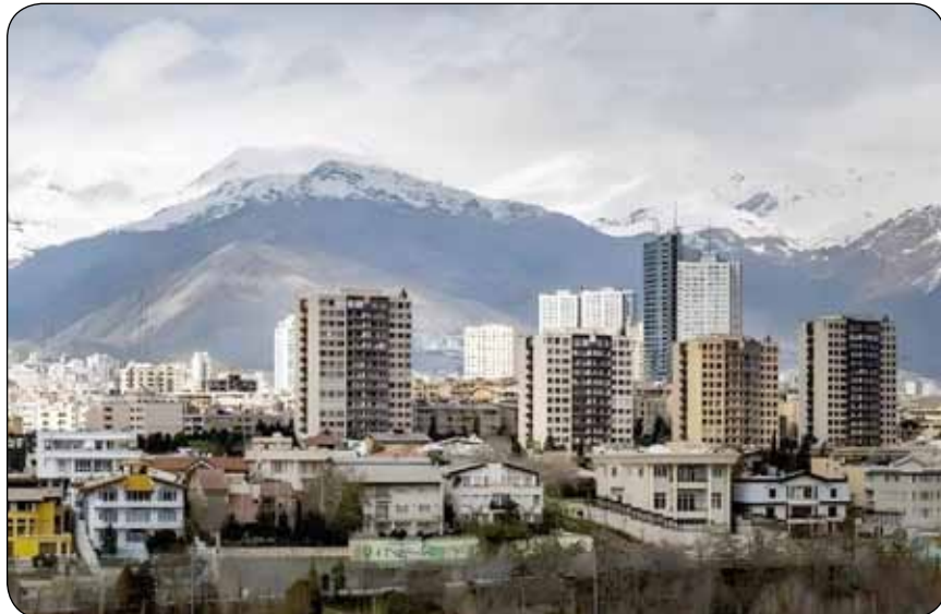
از امکانات اولیه همچون راه هم بی‌بهره هستند، سبزه فلک کشیده و چند برابر شده است. حال در شرایطی که تولید مسکن در کشور مشکل دارد، سؤال این است که آیا راهی برای مهار قیمت اجاره خانه وجود دارد؟

نگاهی به اجاره‌نشینی در کشور از دیروز تا امروز