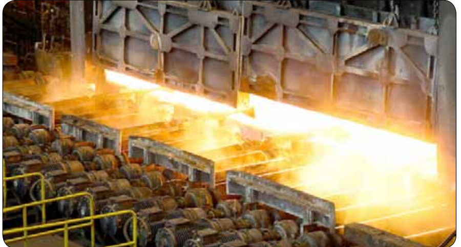
گروه زمین و معدن | متناقصه

با توافقی شدن ارزش حاصل از صادرات زنجیره فولاد