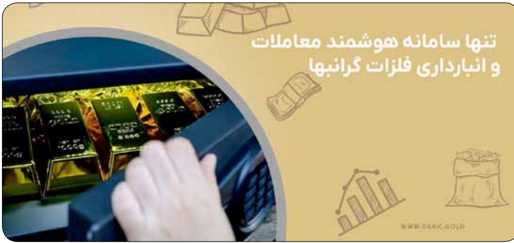
تنها سامانه هوشمند معاملات و انبارداری فلزات گرانبها