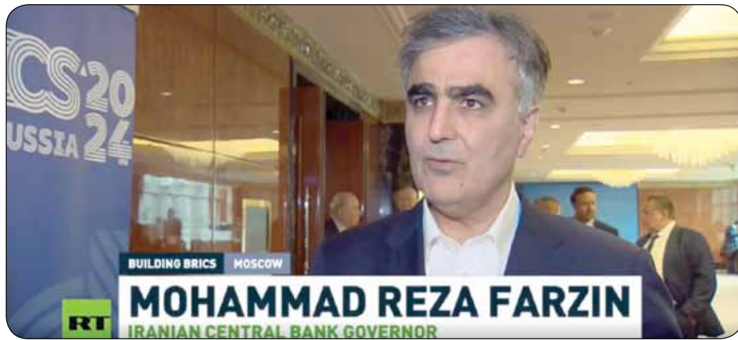
توافقات خوبی در مورد پرداخت‌های ذخیره جهانی و استفاده از اوراق قرضه برای پرداخت‌ها صورت گرفت. فرزین گفت: در حال حاضر، سیستم مالی جهانی بیشتر براساس صندوق بین‌المللی پول، بانک جهانی و کشورهای غربی بنا شده است. متأسفانه به دلیل تعاملات