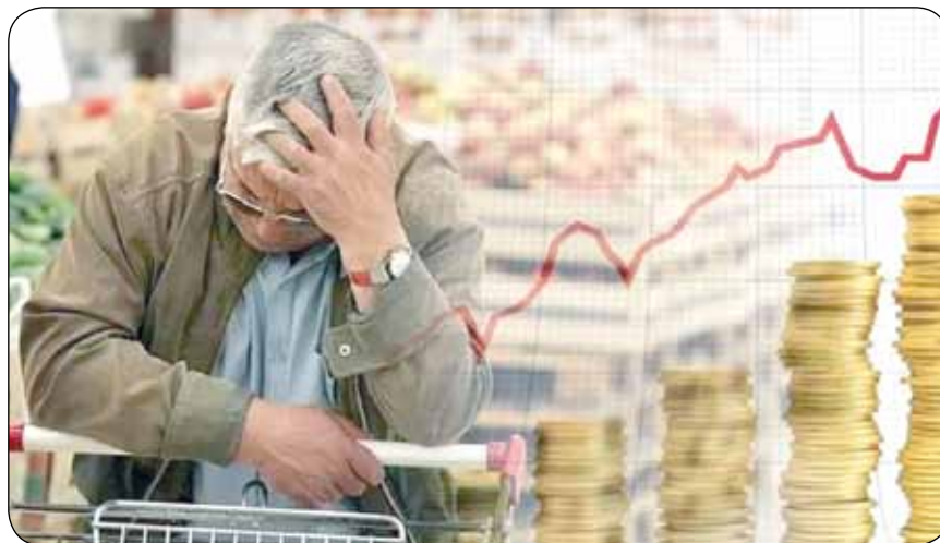
کارگاه‌های تولیدی کوچک ورشکسته شوند و همین مسئله به بیکاری دامن می‌زند. از سوی دیگر کارفرما به دلیل همین تورم توان پرداخت به موقع حقوق و مزایای کارگران را ندارد

شود. اینکه رئیس دولت بگوید دستور داده‌ایم تورم کنترل شود، نمی‌تواند برای مردم عامل کنترل تورم باشد. اقتصاد دستوری ناپدید کننده است. این مسائل باید به‌طور جدی از سوی صاحب‌نظران مورد نقد و بررسی قرار بگیرد. باید کار به افرادی سپرده شود که در این زمینه صلاحیت دارند. نه کسانی که تنها به شعار دادن بسنده می‌کنند و هیچ خروجی عملی از آن‌ها دیده نمی‌شود.