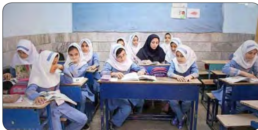
رتبه‌بندی برای او محاسبه می‌شود رتبه یک است. با این تفاسیر معلم چرا باید تلاش کند. در کل، اجرای نظام رتبه‌بندی بد نیست اما نسبت به آنچه که جامعه معلمان انتظار دارند، نبوده و نتوانسته آن‌ها را راضی کند.