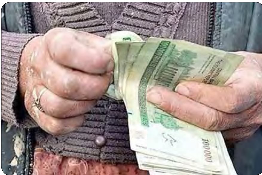
مردم تاب‌آوری ندارند!